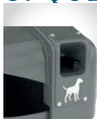
Dispensador de sacos caninos