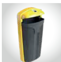
Identificação da fracção com tampa colorida