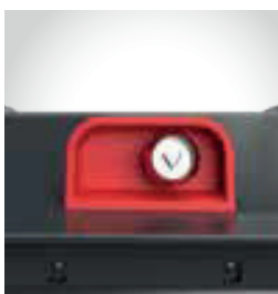
Fechadura automática com chave triangular