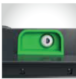
Fechadura manual com chave individual