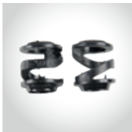
Amortecedores de plástico para as rodas