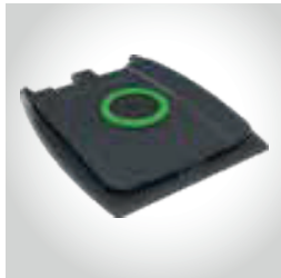
boca circular com obturador 150 mm