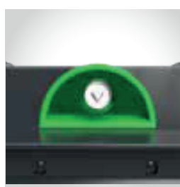
Fechadura manual com chave triangular