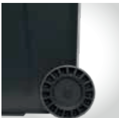
Rodas recicladas e recicláveis Ø 200mm