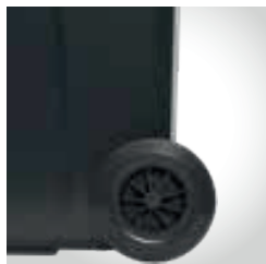
Rodas com borracha sólida Ø 200mm