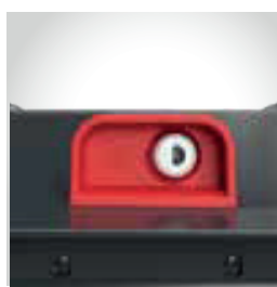
Fechadura automática com chave individual