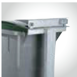
Poste de fixação