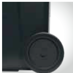
Rodas com borracha sólida Ø 200mm